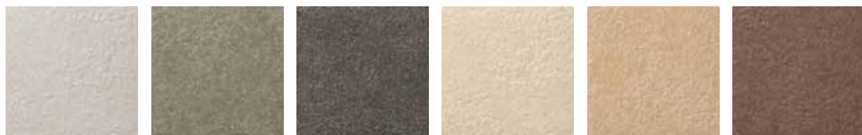
IPF-300/GRL-11 IPF-300/GRL-12 IPF-300/GRL-13 IPF-300/GRL-14 IPF-300/GRL-15 IPF-300/GRL-16