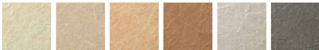
IPF-300/GRL-1 IPF-300/GRL-2 IPF-300/GRL-3 IPF-300/GRL-4 IPF-300/GRL-5 IPF-300/GRL-6