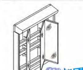
3面鏡(全収納・スタンダードLED) MVJ1-753TXSU