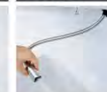
ホースを引き出して、ボウル手前に水を流すこともできます。