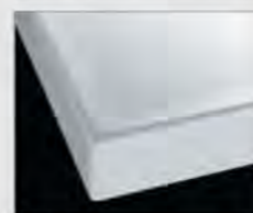
H プレーンホワイト