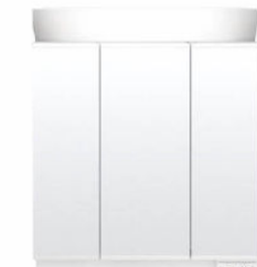
スタンダードLED照明・3面鏡・全収納 MEB-753TXSU