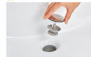
排水口の中までスポンジでサッとお掃除できます。 水を通しやすい大口径φ55の排水口です。