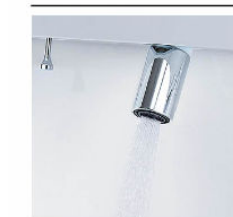
シャワー吐水 水ハネの少ない微細シャワーは従来比の20%の節水ができます。