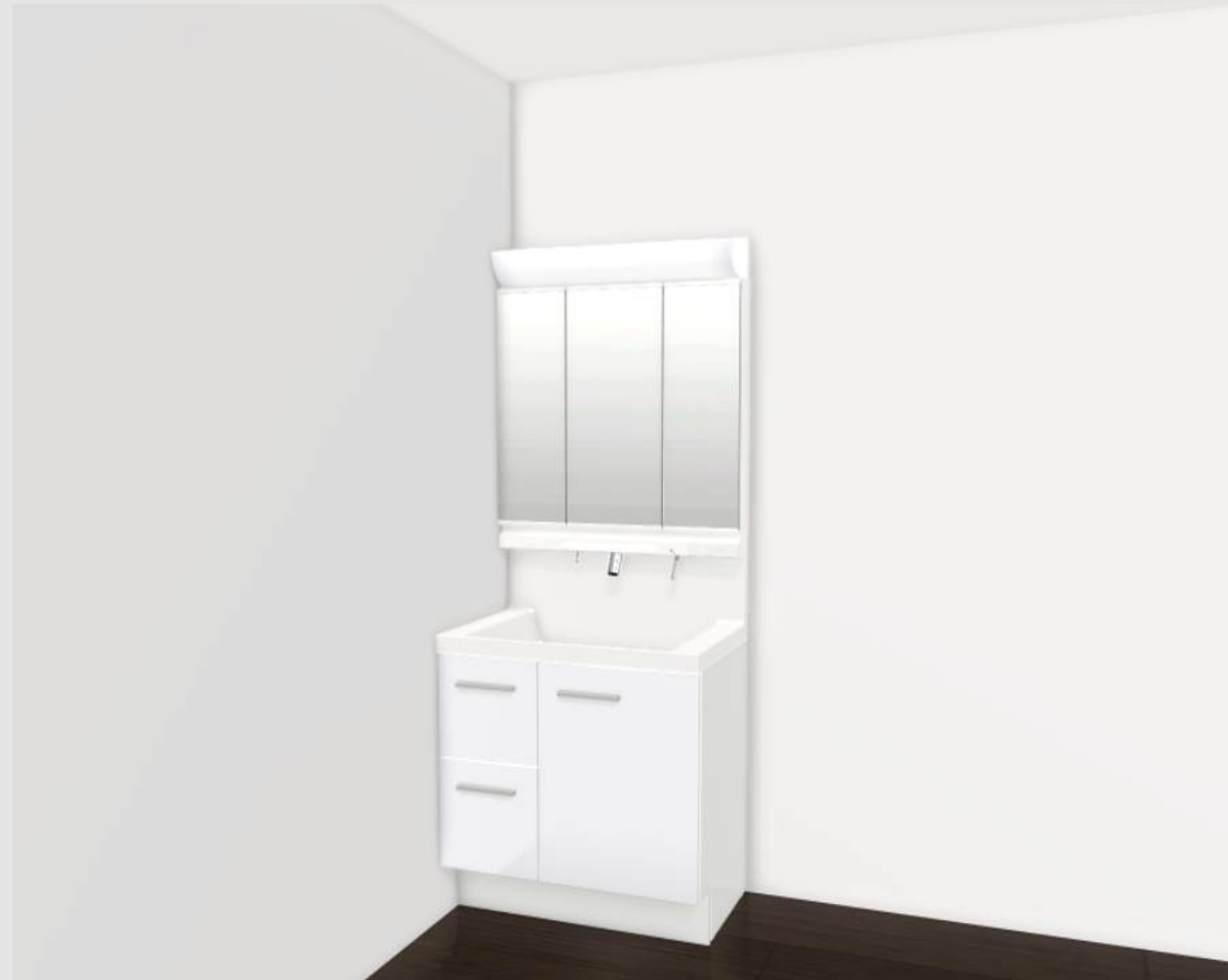
CG合成によるイメージ画像です。