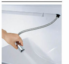
ホースを引き出して使えるので、ボウル手前に水を流すこともできます。