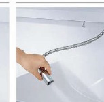
ホースを引き出して使えるので、ポウル手前にお水を流すこともできます。