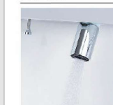
シャワー吐水 水ハネの少ない微細シャワーは従来比の20%の節水ができます。