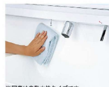
※写真は自動水栓タイプです。 一体成形カウンターで お手入れ簡単。