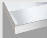
H プレンス材ホワイト