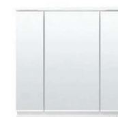
スリムLED照明・3面鏡・全収納 MEB-753TXJU