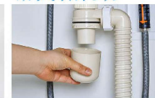
トラップのお掃除まで簡単