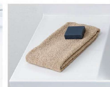
カウンターは 仮置きスペースにピッタリ。